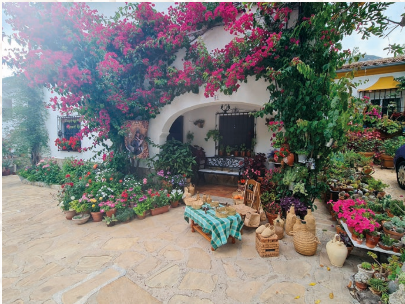
PRIMER PREMIO Isabel Jarillo Calvillo